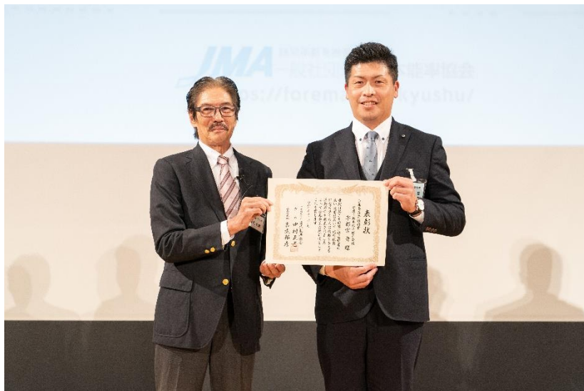
日産自動車九州 宇都宮様