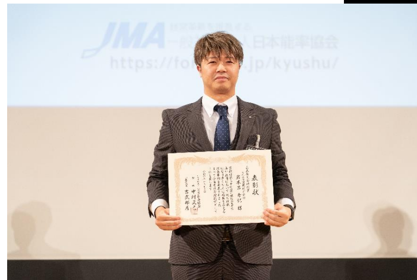
コベルコ建機 岩木呂様